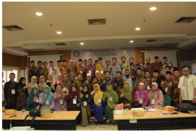
Ketua dan Sekretaris Jurusan Ilmu Hadis, mengikuti acara Simposium Nasional Asosiasi Ilmu Hadis (ASILHA) Indonesia di Surabaya Tahun 2018