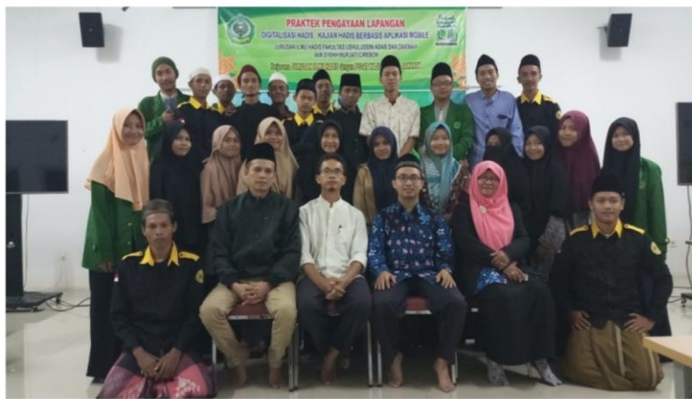
Praktek Pengayaan Lapangan (PPL) Mahasiswa Jurusan Ilmu Hadis di PUSAT KAJIAN HADIS Jakarta