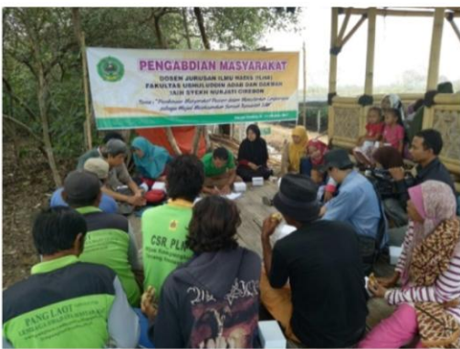
Pengabdian Masyarakat Jurusan Ilmu Hadis dengan tema "Pembinaan Masyarakat Pesisir dalam Melestarikan Lingkungan Sebagai Wujud Melaksanakan Sunnah Rasulullah SAW" di Klayan Cirebon